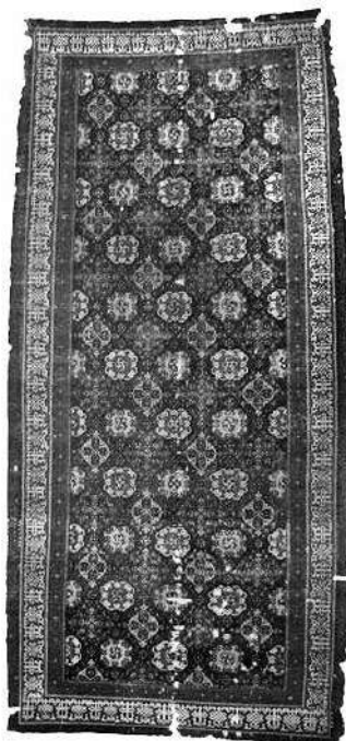
Նկ. 4. Հորայն տիպի գորգ, 15-16-րդ դդ., Բոստոնի գեղարվեստական թանգարան:

րի հորինվածքային կառուցվածքն ու զարդաձևերը, ապա շրջագոտին հարդարվում է տեղական արվեստի ավանդույթներին հարազատ պատկերներով: Բուսանախշերը՝ հիմնականում արմավները, կենդանիները հիմնովին տարբերվում են հայկական գորգերի վրա պատկերվող արմավենյակների, ծառերի, թռչունների և այլ կենդանիների պատկերներից: Գորգադաշտի և շրջագոտու պատկերների միջև զգալի ոճական տարբերությունը նկատելի է: Ինչը նույնպես մեզ իրավունք է տալիս մտածելու, որ գորգադաշտի պատկերների ու գույների մեջ պահպանել են Իսպանիայում հայկական ծագում ունեցող գորգերի ավանդույթները: Բոստոնի թանգարանում գտնվող իսպանական գորգերից մեկը Ֆոլքմար Գանտցհորնի կարծիքով զարդարված է հայկական զարդապատկերներով 7 (նկ.4): Ֆ. Գանտցհորնը հիշատակում է Մատենադարանի ձեռագրատանը պահվող N 8205 11-րդ դ. նկարազարդ Ավետարանի պատկերները: Իսպանական այս գորգի հորինվածքն ու զարդաձևերը գրեթե նույնությամբ կրկնում են նաև N 6305 14-րդ դ. Սյունիքի Ավետարանի խորանի պատկերը: Արջնի պլանում նստած է ավետարանիչ ս. Մաթևոսը, իսկ խորքային ուղղահայաց տարածությունն ունի Արցախ-Սյունիքի գորգարվեստից հայտնի նկա-