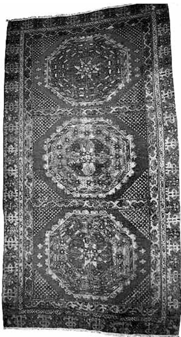
Նկ. 3. Հայկական գորգ, Կոնիա, 15-րդ դ., Ֆիլադելֆիա, Արվեստի թանգարան: