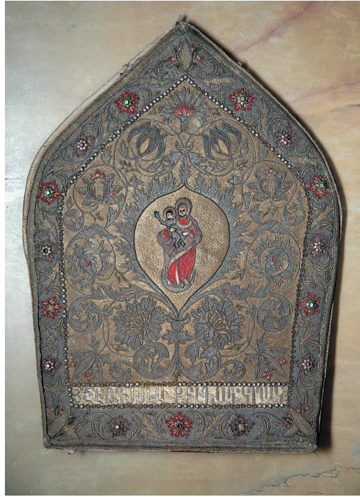
Նկ. 1. Խոյր, 1795 թ., Արցախ, Սր. Էջմիածնի «Ալեք և Մարի Մանուկյան» գանձարան