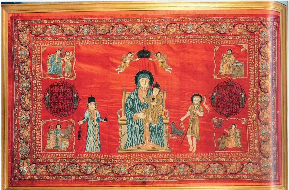
Նկ. 2. Վարազդյր, 1771 թ., Ագուլիս, Սր. Էջմիածնի «Ալեք և Մարի Մանուկյան» գանձարան