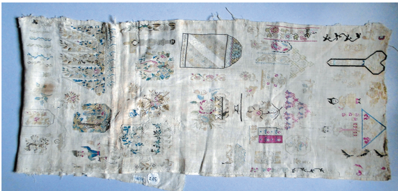
Նկ. 10 Ասեղնագործության օրինակ, 19-րդ դար, Ագուլիս, ՀՊԹ, Ա 397