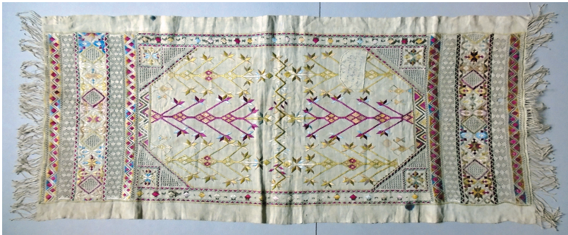
Նկ. 8. Սրբիչ, 18-րդ դար, Արցախի, ՀՊԹ, Ա 8410/3