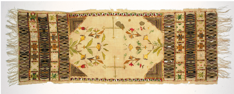
Նկ. 9 Սրբիչ, 18-րդ դար, Արցախի, ՀՊԹ, Ա 266