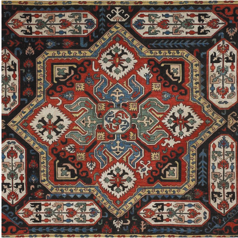
Նկ. 3. Ասեղնագործ գորգիկ, 18-րդ դար, Արցախ, Սր. Էջմիածնի «Ալեք և Մարի Մանուկյան» գանձարան