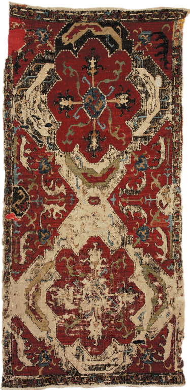
Նկ. 5. Ասեղնագործ գորգ, 18-րդ դար, Արցախ, ՀՊԹ, Ա 686