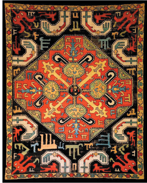
Նկ. 4. Ասեղնագործ գորգիկ, 18-րդ դար, գ. Շոշ, Արցախ, Վ. Ասմարոյանի հավաքածու (Շոշիի գորգի թանգարան)