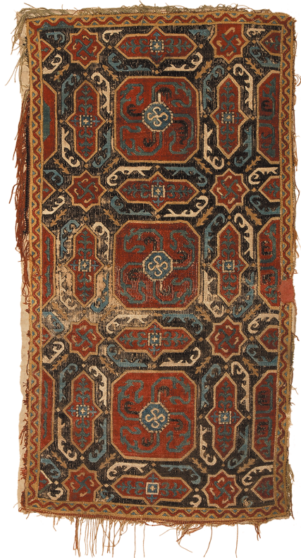
Նկ. 6. Ասեղնագործ գորգ, 18-րդ դար, Արցախ, ՀՊԹ, Ա 687